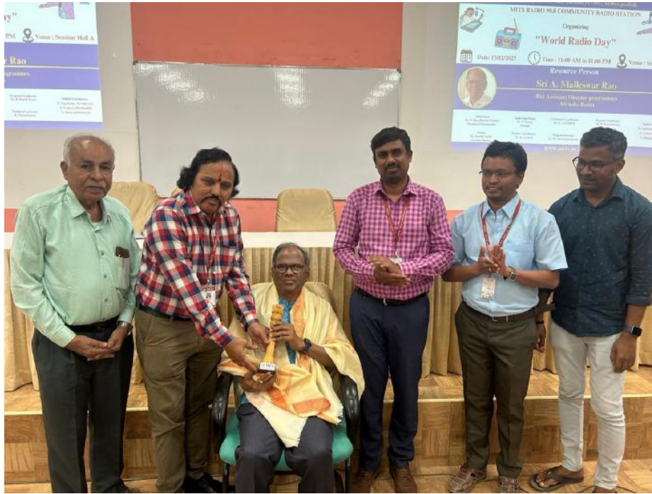
Figure 6: Felicitation to Chief Guest