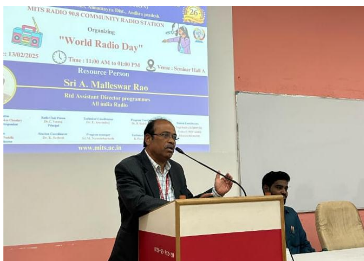
Figure 2: Inaugural Speech by Principal, MITS