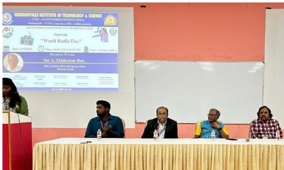
Figure 1: Inaugural Ceremony

MITS Community Radio 90.8 celebrated World Radio Day on 13 th February 2025 at Seminar Hall A from 11:00 AM to 1:00 PM. The event witnessed an enthusiastic participation of 140 students.