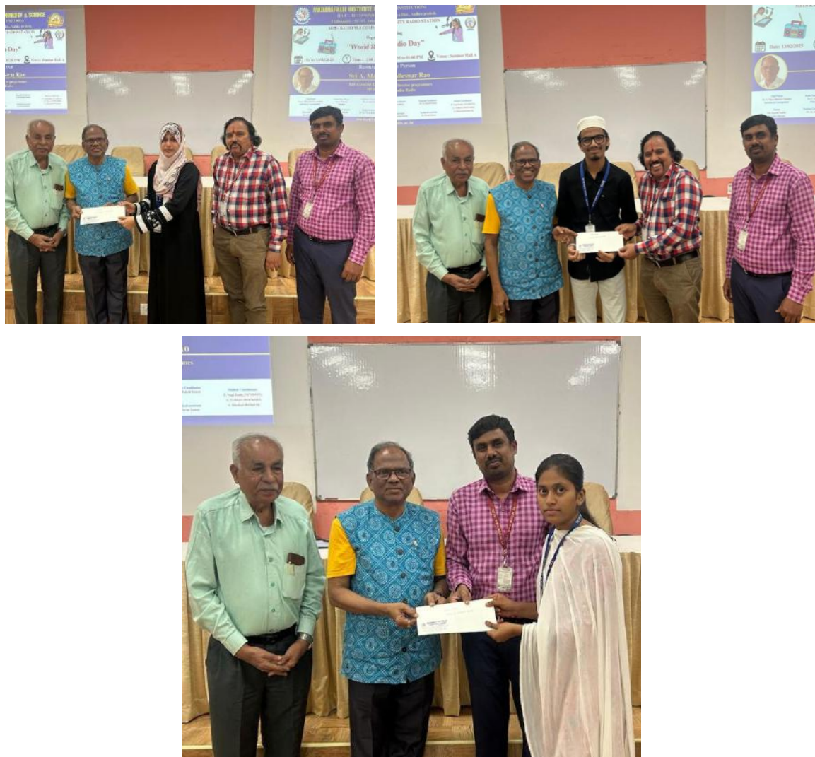
Figure 5: Prize Distribution for the students participated in World Radio Day Competitions

As part of the World Radio Day celebrations, students were recognized for their outstanding performances in various competitions, including Script Writing, Extempore Speech, Content Reading, and Stand-up Comedy. The Chief Guest, Sri A. Malleswara Rao, honoured the winners by distributing prizes, encouraging them to continue honing their skills and actively participating in radio-related activities.