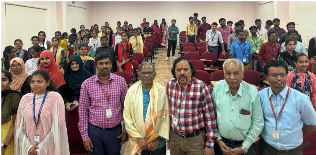
Figure 7: Group Photo with Participants